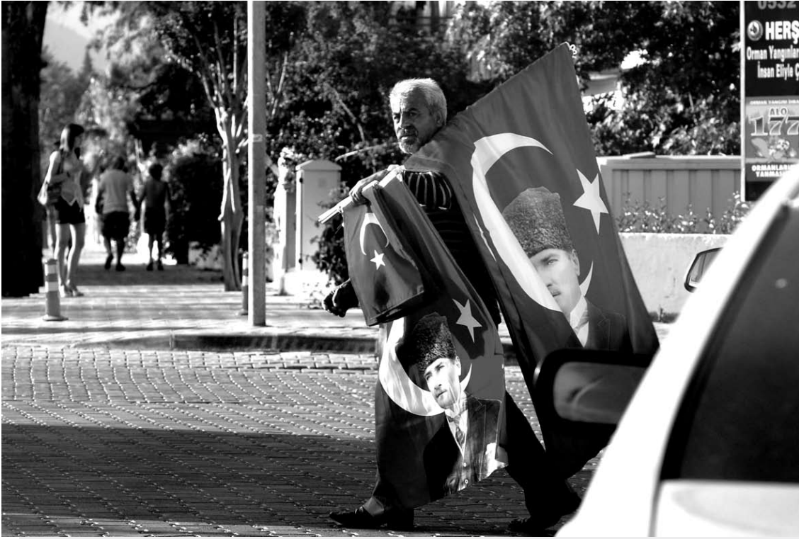
Nors šalį krečia neramumai, Turkijos kurortuose tyro ramybė.

„Ar nebaisu ten skristi?“, - pildydama kelionės draudimo dokumentą manęs pasiteiravo draudimo bendrovės darbuotoja. „Jeigu bus lemta, automobilis partrenks iš jūsų ofiso keliaujant į kitą gatvės pusę“, - atsakiau jai. Jau po kelių dienų, rugpjūčio viduryje, su smagia ir gausia, daugiau nei dešimties bičiulių kompanija iš Vilniaus oro uosto kilome į dangų. Antrąsį gyvenimą į Turkiją pasimėgauti atostogų malonumais.