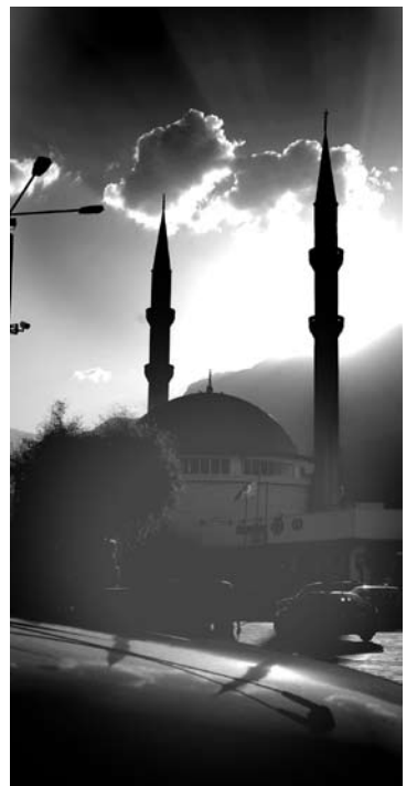
Iš mečečių naktimis pro garsiakalbius maldos bei giesmės pasklinda visu garsu.