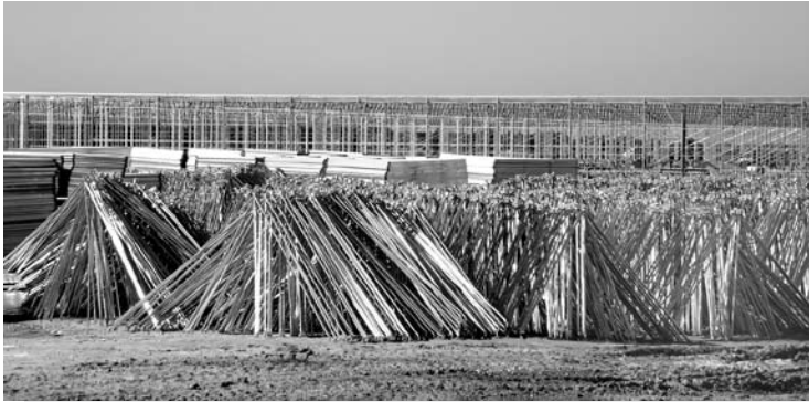
Įstatymų pataisais, įteisinančias statybas ant kvarcinių smėlio klotų, labiausiai kritikuoja Lietuvos karjerų asociacija.