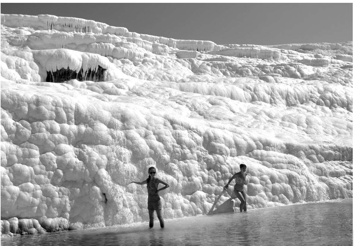
Pamukalės vandenyse senovėje maudydavosi graikų ir romėnų didikai, imperatoriai. Tai vienas svarbiausių Turkijos turistinių objektų.