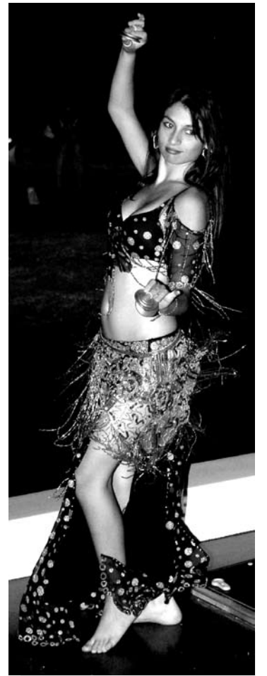
Viešbučiuose išikūrusiems poilsiautojams netrūksta muzikos, šokių ir kitos pramoginės veiklos.